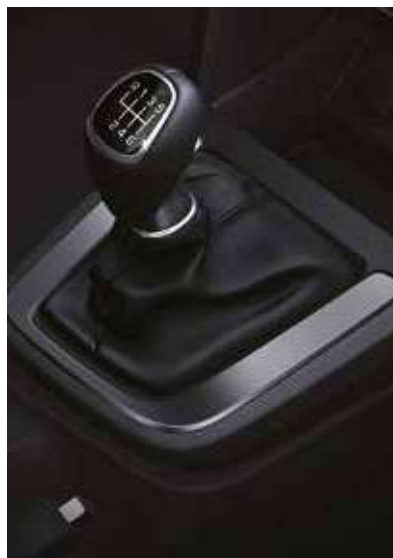
Transmisie manuală cu șase trepte de viteză