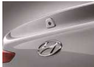
Cameră video spate