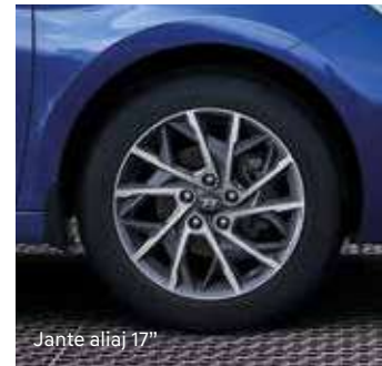
Jante aliaj 17"