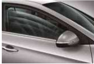
Geamuri electrice față și spate