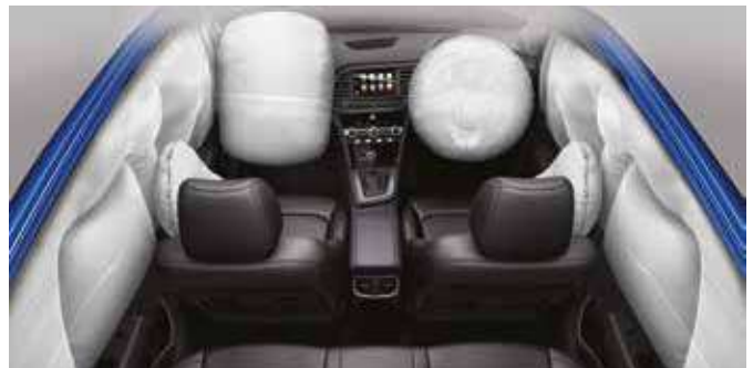
Sistem de șapte airbaguri