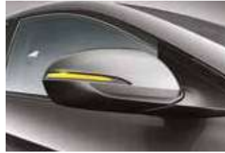
Oglinzi laterale, acționate electric și încălzite, cu semnalizare tip LED