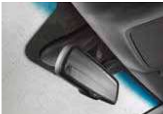
Senzor de ploaie