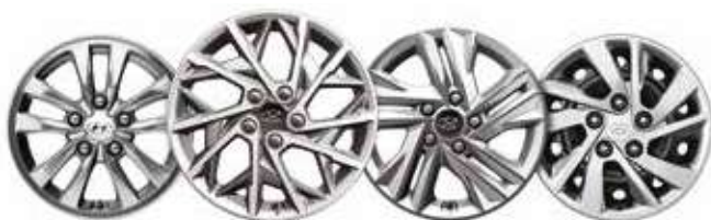
Jante aliaj 15"