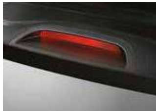
Stop suplimentar frână