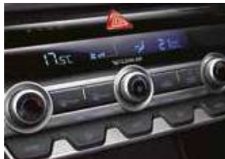
Sistem automat de climatizare