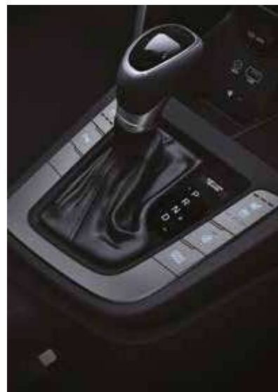
Transmisie automată cu șase trepte de viteză