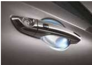
Mânere exterioare uși cu inserții cromate