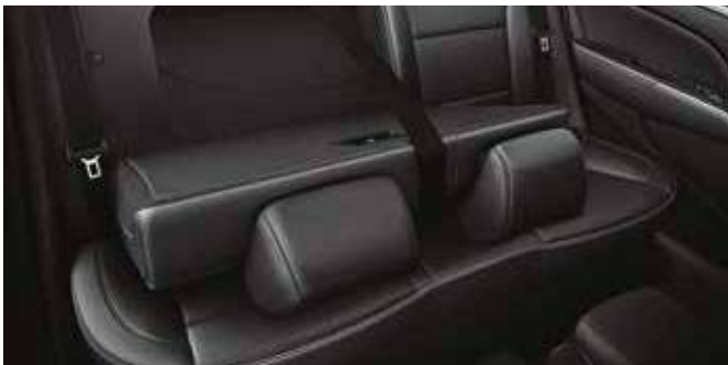
Sistem de rabatare scaune 6:4