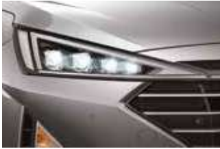
Faruri cu sistem HID