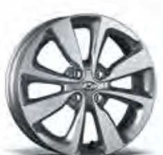
jante din aliaj de 16"