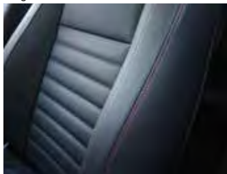
Piele neagră/ inserții de culoare roșie