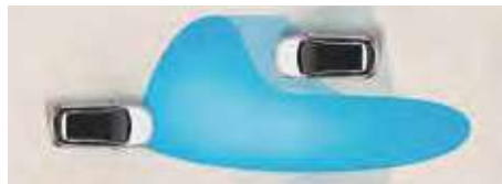
Sistem de asistență pentru faza lungă (HBA)