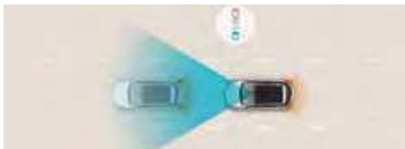
Sistem de asistență la coliziune frontală (FCA)