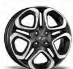
jante din aliaj de 16"