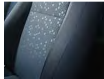
Material textil/ inserții de culoare albastră