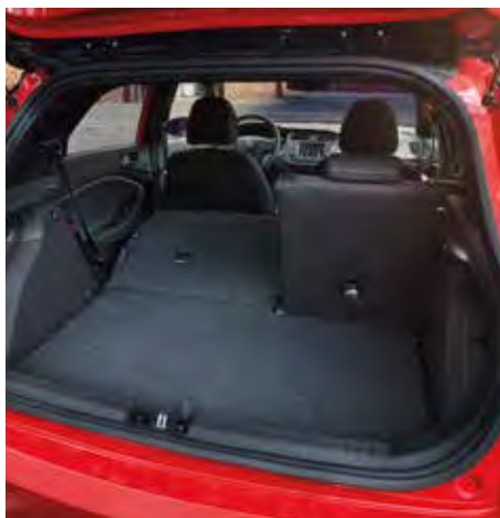
Sistem de rabatare scaune spate 60:40