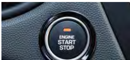
Buton pornire/ oprire a motorului („Start/ Stop”)