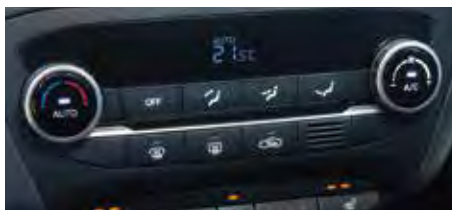
Instalație de climatizare automată