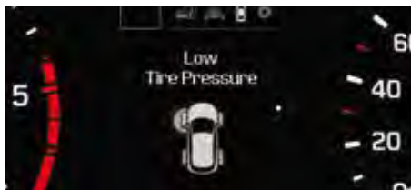
Sistem de monitorizare a presiunii în pneuri