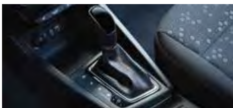
Transmisie automată cu 7 trepte și dublu ambreiaj (DCT)