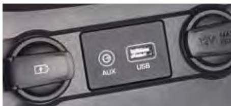
Conectivitate - porturi USB și AUX