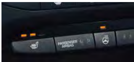
Volan/ Scaune încălzite