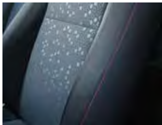
Material textil/ inserții de culoare roșie