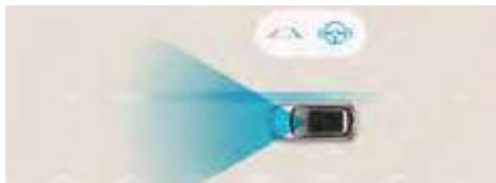
Sistem de asistență la menținerea benzii de rulare (LKA)