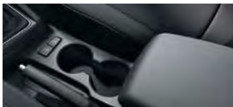
Cotieră centrală și suport pentru pahare