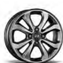
jante din aliaj de 15"

Mostrele de culoare prezentate pot varia ușor față de realitate, din cauza condițiilor de iluminare și a procesului de tipărire. Pentru informații complete, vă rugăm să contactați distribuitorii Hyundai Auto România.