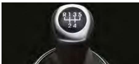
Transmisie manuală cu 5 trepte