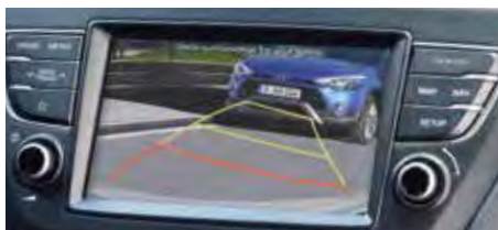
Cameră video marșarier