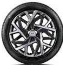
Jante din aliaj de 18"