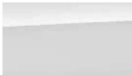
Alb Chalk Metalic (P6W)