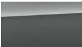
Gri Galactic Perlat (R3G)