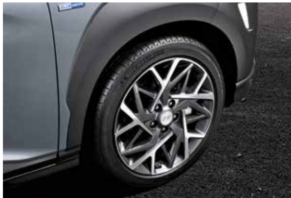
Jante din aliaj de 18"