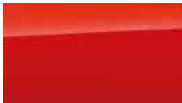
Roșu Tangerine Perlat (TA9)