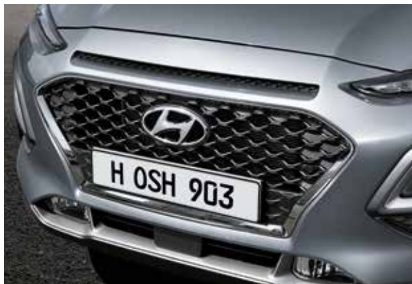
Grilă tip cascadă