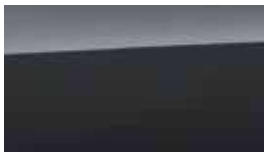
Gri Dark Knight Perlat (YG7)