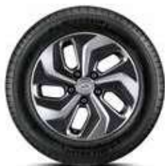
Jante din aliaj de 16"

Lumini spate cu LED Încărcare wireless Scaune spate încălzite Frână de mână electrică