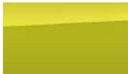
Galben Acid Metalic/ Perlat (W9Y)