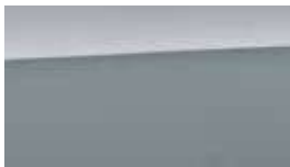
Argintiu Lake Metalic/ Perlat (SS7)