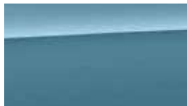
Albastru Ceramic Perlat (SU8)