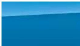
Albastru Lagoon Metalic/ Perlat (Z3U)