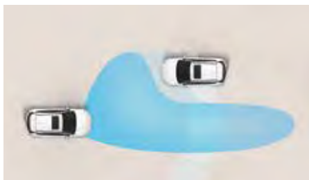
Sistem de asistență pentru faza lungă (HBA)