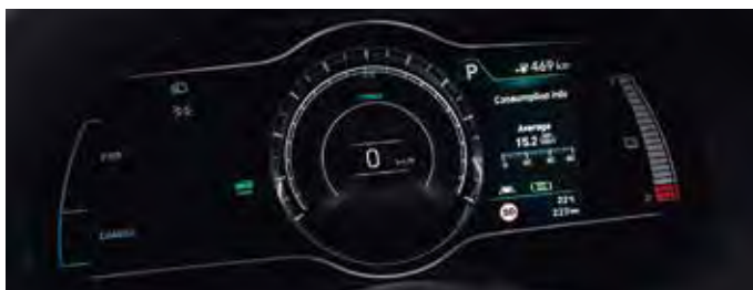
Instrumentar de bord cu ecran color TFT LCD de 7"