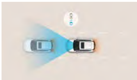
Sistem de asistență la coliziune frontală (FCA) cu detectare pietoni