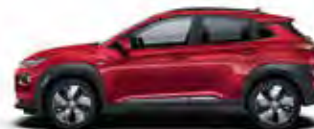
Roșu Pulse Metallic/ Perlat (Y2R)