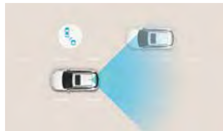
Sistem de monitorizare a unghiului mort (BCW)