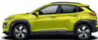
Verde Acid Metallic/ Perlat (W9Y)