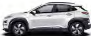
Alb Chalk Metallic (P6W)