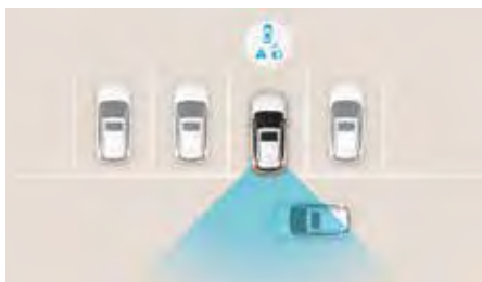
Sistem de avertizare pentru evitarea coliziunilor la deplasarea în marșarier (RCCW)