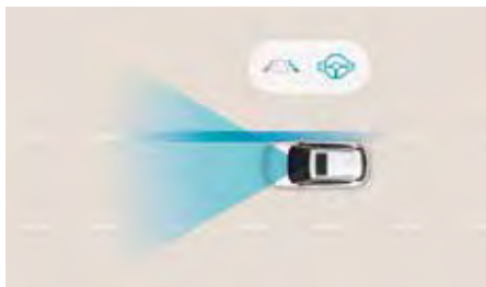
Sistem de asistență la menținerea benzii de rulare (LKA)