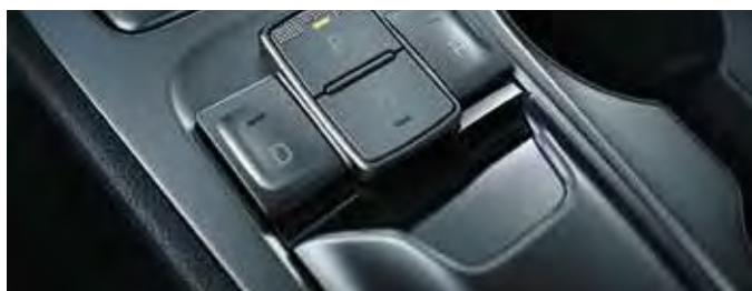
Consolă pentru schimbarea pozițiilor de condus „shift-by-wire”