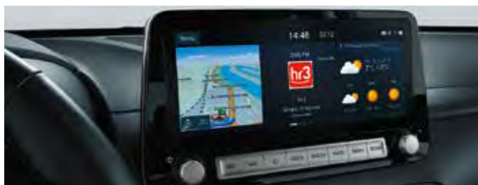
Sistem de navigație cu ecran tactil de 10,25"